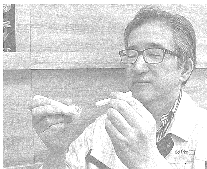
シバセ工業のアルコール検知器用ストロー

旅客・貨物輸送業者のドライバーが点呼時などに行う飲酒チェック用の個包装の商品。感染リスクへの懸念から使い捨てできる同商品への需要が高まっているほか、外出自粛に伴う宅配需要の増加でドライバーの数も増えていることなどから、これまで取引のなかった大手運輸会社から全ドライバー分の大量受注が入るなど、月10万~20万本だった出荷量は3倍を超える60万本以上に増加。生産能力を上回る発